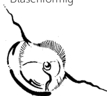
Blasenförmig mit Rissen